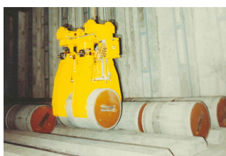
Alvéole d'entreposage des CAC